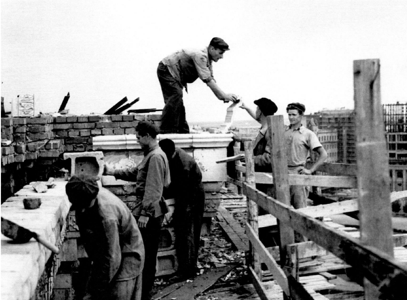
Студенти відбудовують майбутній Головний корпус університету