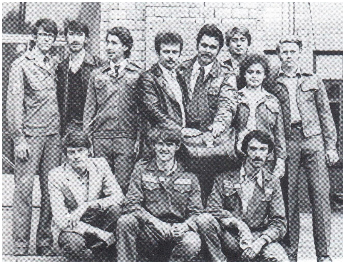
Учасники студентського будівельного загону «Комунар», які перераховували 70% зароблених коштів на будівництво пам'ятника студбатівцям (1981 рік)