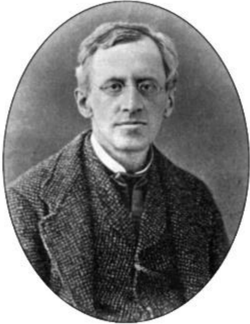
Бецький Іван Єгорович (1818–1890)