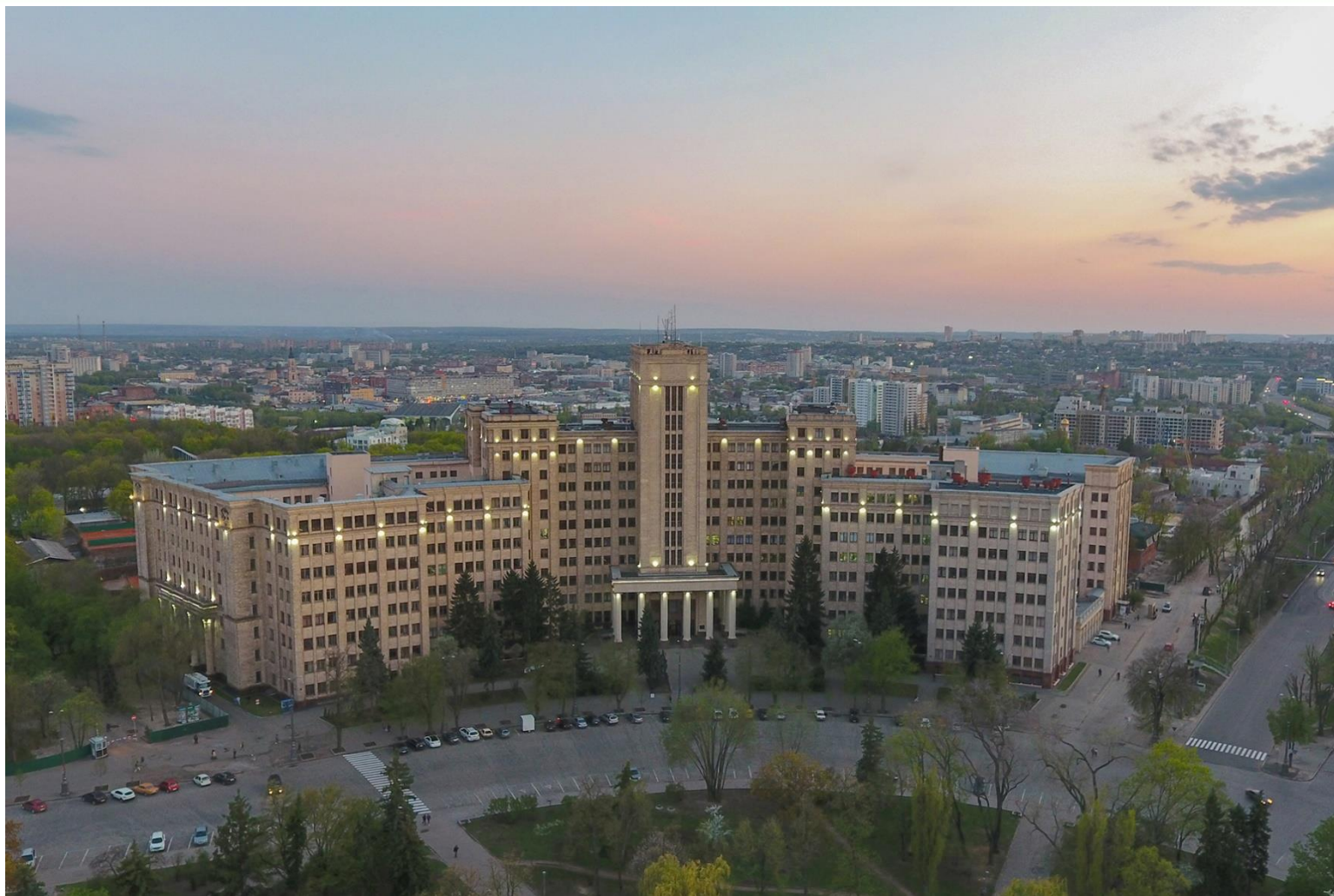
Головний корпус Каразінського університету (2018 рік)