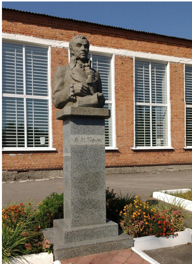
Пам'ятник В. Н. Каразіну в селі Кручик