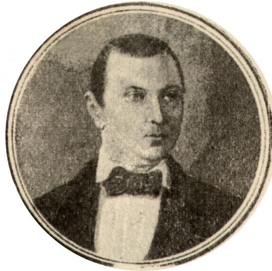
Алфьоров Аркадій Миколайович (1811–1872)