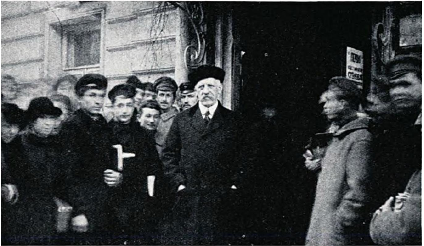
Фрітьоф Нансен з харківськими студентами біля входу до їдальні (28 січня 1923 рік)