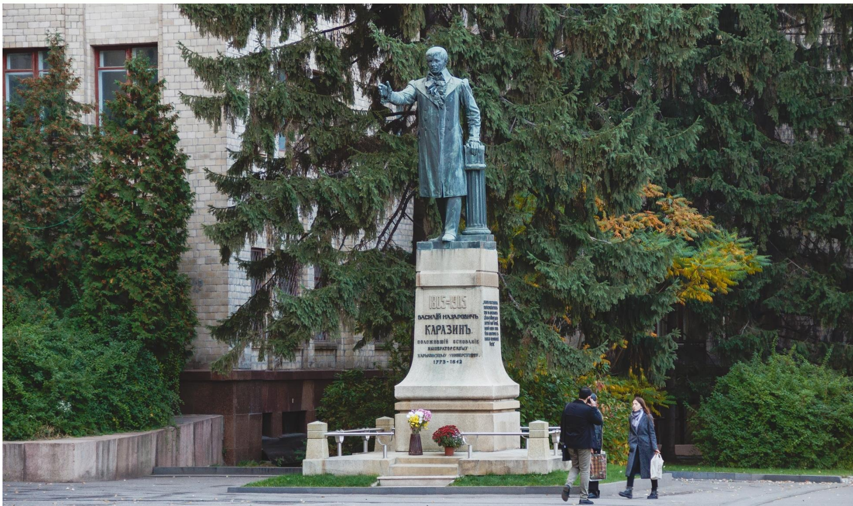
Засновник університету – Василь Назарович Каразін